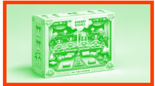
Rosalia Namsai Engchuan »Energy Body« (2024)

An der Schnittstelle von Klasse, Geschlecht, Sexualität und – wenn man so sagen darf – Träumen würdigt IN NOBODY'S SERVICE den sich neu geformten Realitäten jenseits ihrer weißen Ehemänner oder der gesellschaftlichen Verhältnisse – jetzt für uns verfügbar, jetzt in niemandes Diensten. Im Folgenden wird die Position der jeweiligen Ausstellungskünstler*innen vorgestellt.